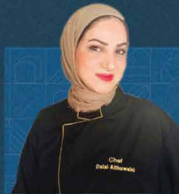
الشيف دلال الثويني