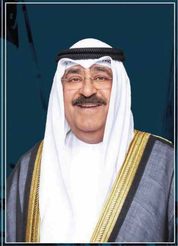
حضرة صاحب السمو أمير البلاد الشيخ مشعل الأحمد الجابر الصباح حفظه الله ورعاه