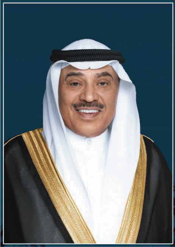
سمو ولي العهد الشيخ صباح خالد الحمد الصباح حفظه الله